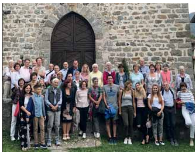
Die Besucher aus Schöngeising mit ihren italienischen Freunden in Cornello dei Tasso.